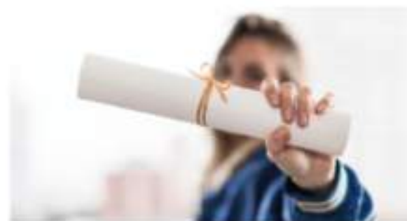
Descuentos en Universidades

Clases de inglés en grupos reducidos con profesores certificados.