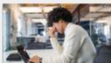
Estrés y Burnout

Blog de Salud Mental - ¡Leé todos los artículos!