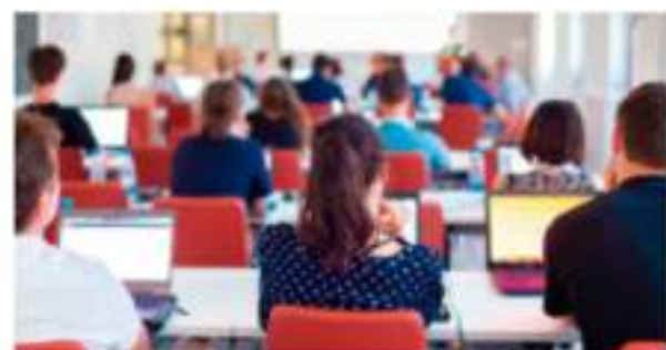
Clases virtuales de Inglés

Para más información contactar al área de Capacitación y Desarrollo TGV: capacitacion@tgv.com.ar